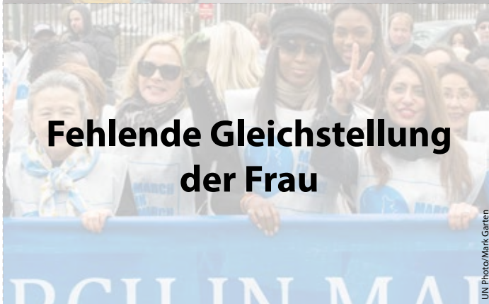
Fehlende Gleichstellung der Frau