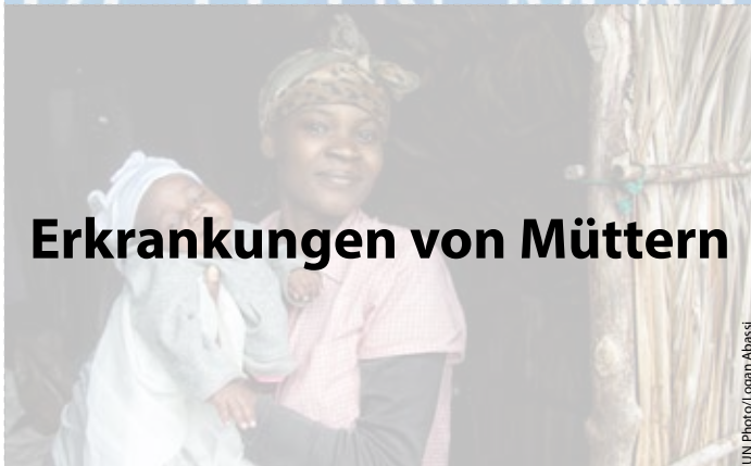
Erkrankungen von Müttern