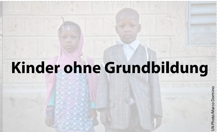
Kinder ohne Grundbildung