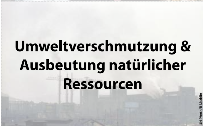
Umweltverschmutzung & Ausbeutung natürlicher Ressourcen