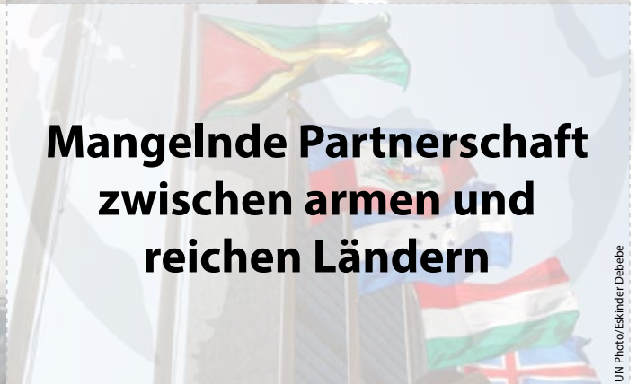
Mangelnde Partnerschaft zwischen armen und reichen Ländern