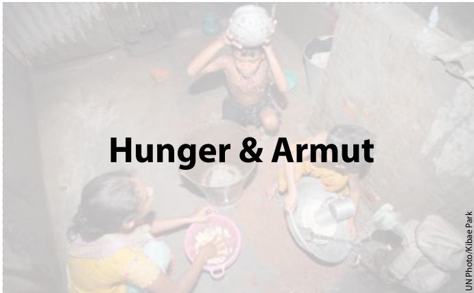
Hunger & Armut